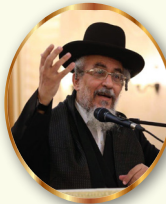
מתוך שולחן ערוך המקוצר של מרן הגאון רבי יצחק רצאבי שליט"א

לא רחץ שם), והנוטל צפרניו, והמגלח שערותיו, והחולץ מנעליו בידיו או נוגע בהן, והמשמש מטתו, והנוגע בכנה, והמפלה את בגדיו (פ"ו מנקה את בגדיו מפנינים) ואפילו לא נגע בכנה, והחופף ראשו, והנוגע בגופו במקומות המכוסים, והיוצא מבית הקברות או מלווה את המת או שנכנס באהל המת, והמקזז דם. ובכולם אין צריך ג' פעמים ומתוך כלי, חוץ מן הקם מהמטה, וכן המנהג. והמחמיר לעצמו ליטול בכולם ג' פעמים, ובפרט היוצא מביתהכסא, תבוא עליו ברכה: [יא] על שלוש נטילות מברכים. בשחרית, וקודם אכילת פת, וכן לדבר שטיבולו במשקה לפי מנהג הבלדי: