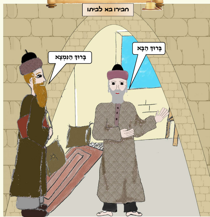
כל הזכויות שמורות למערכת "נחלת אבותינו" אין לשכפל ולצלם ללא רשות בכתב סממנת העלון