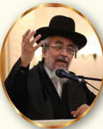
מתוך שלחן ערוך המקוצר של מרן הגאון רבי יצחק רצאבי שליט"א