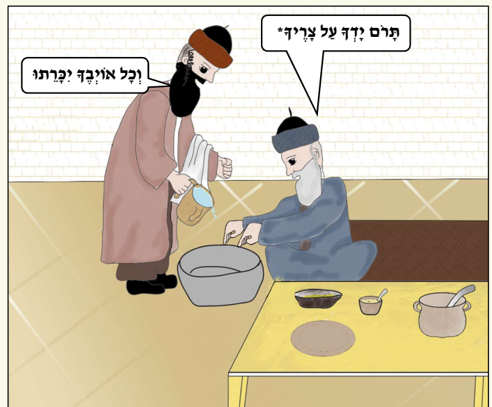
יוש תלמידי חכמים שמוסיפים כנייל במים ראשונים