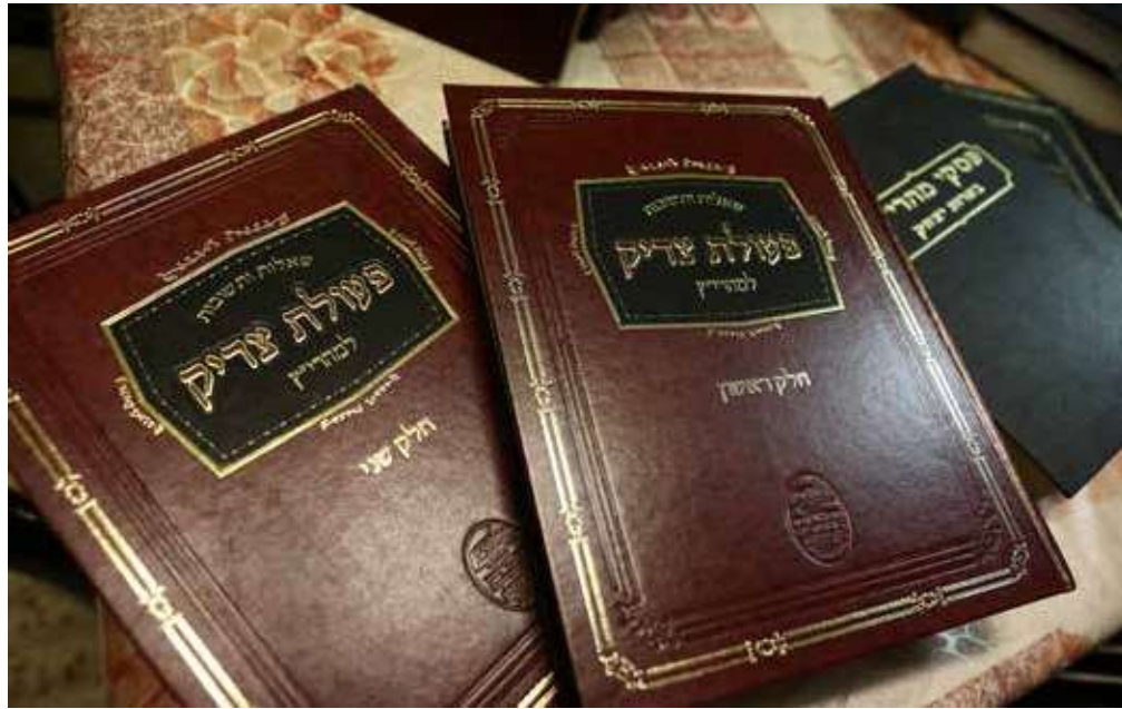
האיר את העולם בתורתו. ספרי מהרי"ץ