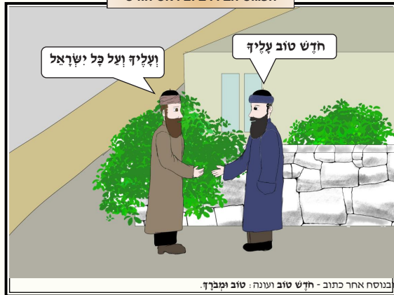
בניסוח אחר כתוב - חֵדֶשׁ טוֹב וְעוֹנָה - טוֹב וּמְבָרֵךְ.